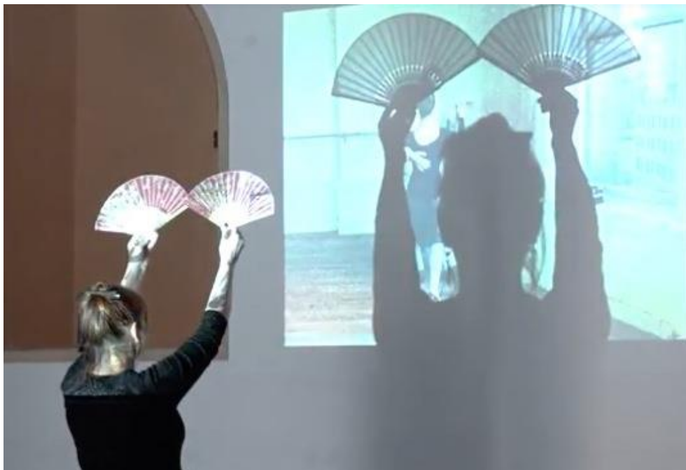
Figure 5. Quand le corps délivre des images , Anis Gras, Arcueil, 2017, dans le cadre des Journées du Matrimoine.

Cette affirmation d'un corps sujet singulier repose paradoxalement sur la mise en évidence des contraintes du corps, sur la mise en scène de corps objets, de corps immobiles, de corps « sans qualités », avec des défauts. Le génie créateur est attaqué dans sa chair. S'attaquer au corps du mythe revient ici à s'attaquer au mythe du corps : le mythe d'un corps maîtrisé, outil « parfait » de la création. Instrumentalisations et contre-performances deviennent le moyen d'exposer son corps au mythe, de faire corps avec le mythe pour mieux le questionner.