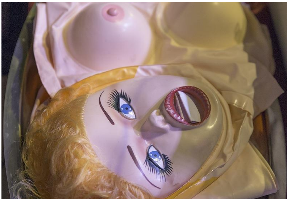
Figure 3. Poupée gonflable présentée sur un plateau d'argent avec images contenues dans la bouche, objet utilisé dans la conférence-performance Quand le corps délivre des images .

Ce qui est en jeu dans la performance est bien l'impact des images du corps sur les corps et le passage d'un corps individuel à un corps collectif. La performance est ainsi inextricablement liée aux représentations du corps et a fortiori lorsqu'elle n'est visible qu'au travers de ses traces photographiques ou vidéos. Ces traces rendent manifeste la « mise en image » des corps à l'œuvre dans la performance ; elles révèlent en outre ce qui se joue de constructions de mythes dans l'art (avec la figure de l'artiste en premier lieu).