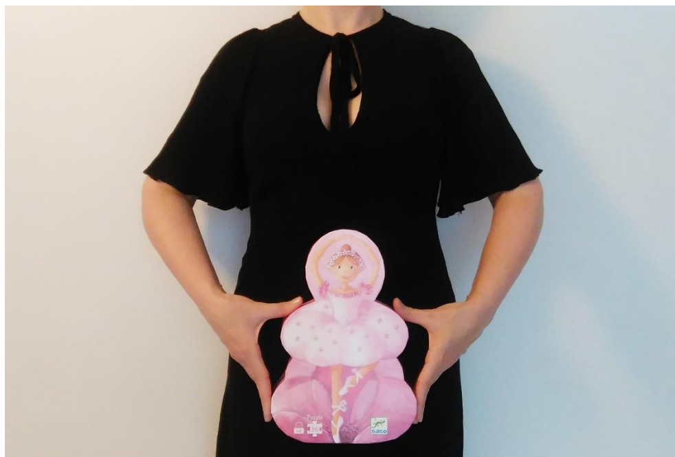
Figure 6. Visuel de présentation pour la conférence-performance Quand le corps délivre des images .

pas renoncer à ce qui nous a construit-e et nous constitue ? La libération est-elle toujours souhaitable, jusqu'à quel point ? Sans doute, avec cet idéal de délivrance, faut-il avoir en tête les possibles dérives totalitaires et prendre garde aux pouvoirs de l'affect. Le fonctionnement « sur le modèle de l'art » des totalitarismes, tel que l'a révélé en particulier Éric Michaud, devrait toujours être à l'horizon de ces pensées potentiellement démiurgiques 16 .