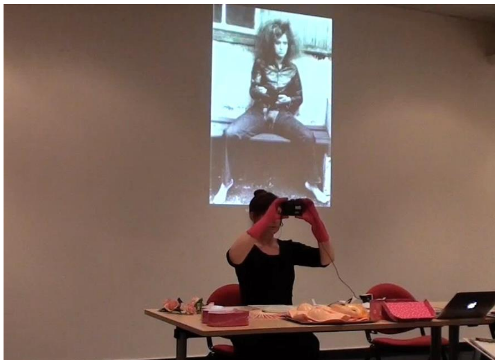
Figure 4. Quand le corps délivre des images , MESHs, Lille, 2016.

La performance correspond, pour des artistes femmes, à une affirmation en tant que sujets-auteurs de leurs propres corps. L'enjeu de cette démarche est de montrer son corps loin d'une idéalisation sclérosante ; de revendiquer sa singularité, sa corporéité, sa sexuaité, sa sexualité, contre un formalisme désincarné, prétendument asexué, universel, mais prônant en fait des valeurs masculines. La performance relève ainsi de l'affirmation de subjectivités diverses et contribue à une remise en question du modernisme.